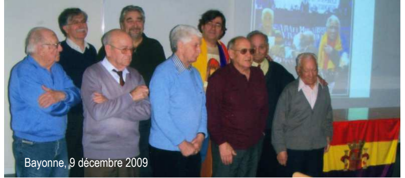
Bayonne, 9 décembre 2009