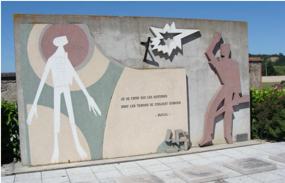
Au cimetière de Noé (Haute-Garonne), monument en mémoire du camp de concentration de Noé, inauguré en 1959, en présence de Maurice Thorez.

Environ 300 000 soldats de l'armée républicaine espagnole ont été enfermés dans les camps de concentration français à partir de février 1939, soit les deux tiers de l'effectif de La Retirada .