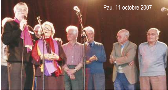
Pau, 11 octobre 2007