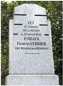
En forêt de Bouconne

Dimanche 29 janvier 2023, devant le monument érigé en forêt de Bouconne, (Lasserre, Haute-Garonne), le maire de Toulouse et président de Toulouse Métropole, Jean-Luc Moudenc, a prononcé l'allocution reproduite ci-dessous.