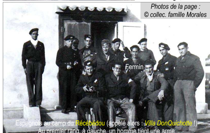
Espagnols au camp du Récébédou (appelé alors : Villa DonQuichotte !) Au premier rang, à gauche, un homme tient une arme