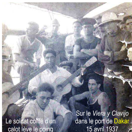
Sur le Viera y Clavijo dans le port de Dakar 15 avril 1937 Le soldat coiffé d'un calot lève le poing

Un transatlantique venant de New-York et faisant escale à Dakar les transporte à Marseille