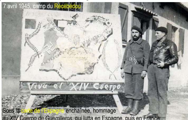
7 avril 1945, camp du Récébédou Sous la carte de l'Espagne enchaînée, hommage au XIV Cuerpo de Guerrilleros, qui lutte en Espagne, puis en France