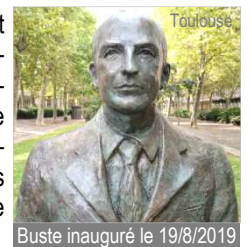
Buste inauguré le 19/8/2019