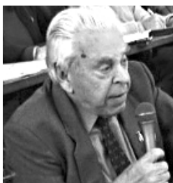
Décembre 2004, université du Mirail, colloque « Maquis de France et d'Espagne ».