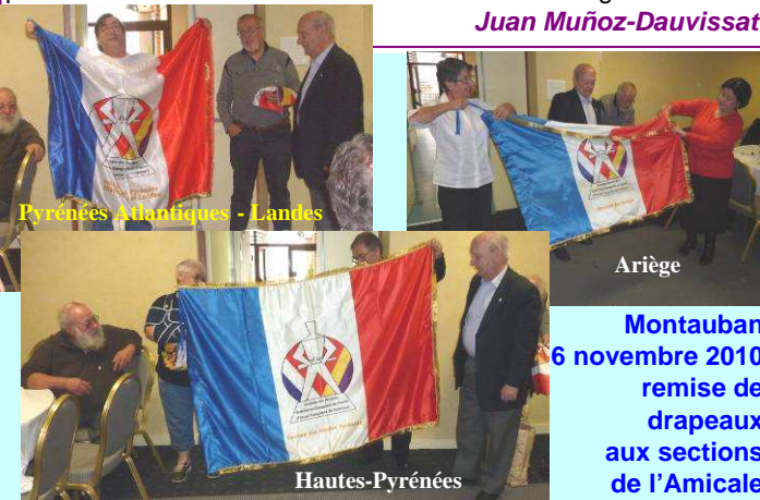
Pyrénées Atlantiques - Landes