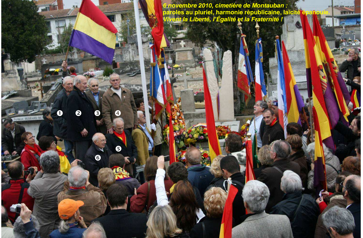
6 novembre 2010, cimetière de Montauban : paroles au pluriel, harmonie républicaine, laïcité épanouie. Vivent la Liberté, l'Égalité et la Fraternité !

Samedi 6 novembre 2010, plus de 500 personnes ont défilé à Montauban, coeur au vent , jusqu'au cimetière où repose, depuis 1940, le dernier président (1936-39) de la République espagnole.