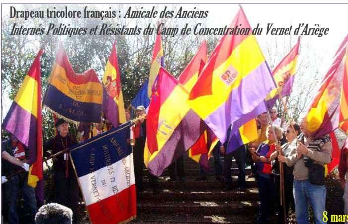
Drapeau tricolore français : Amicale des Anciens Internés Politiques et Résistants du Camp de Concentration du Vernet d'Arriège

Galleries photos : v. sites MER 82 et Espagne au coeur