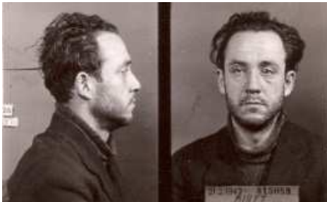
Photos en détention, datées du 21 février 1942