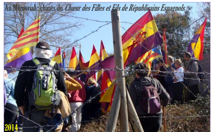
Au Mémorial : chants du Chœur des Filles et Fils de Républicains Espagnols