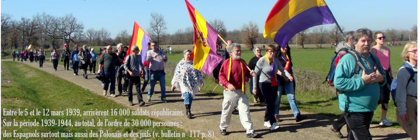
Entre le 5 et le 12 mars 1939, arrivèrent 16 000 soldats républicains. Sur la période 1939-1944, au total, de l'ordre de 30 000 personnes : des Espagnols surtout mais aussi des Polonais et des juifs (v. bulletin n° 117 p. 8).

A l'invitation de Mémoire de l'Espagne Républicaine en Tarn-et-Garonne , 200 personnes se sont retrouvées le 8 mars 2014 à Borredon afin de rendre hommage à tous ceux qui furent débarqués ici pour être enfermés dans le camp de concentration de Septfonds situé 6 km plus loin.