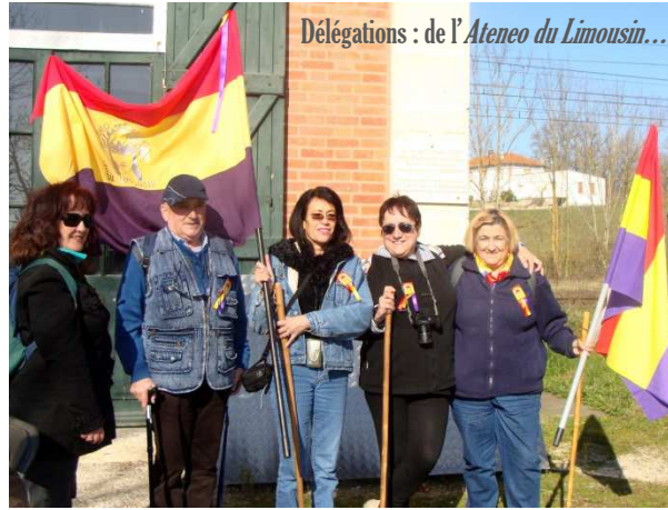
Délégations : de l'Ateneo du Limousin...