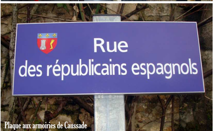
Plaque aux armoiries de Caussade

gare de Borredon car les autorités de l'époque n'osèrent plus arrêter les trains à Caussade pour ne pas alarmer la population. Nous avons fait inscrire cette gare à l'Inventaire du Patrimoine Historique Français, ainsi que le Cimetière des Espagnols et le Mémorial du camp.