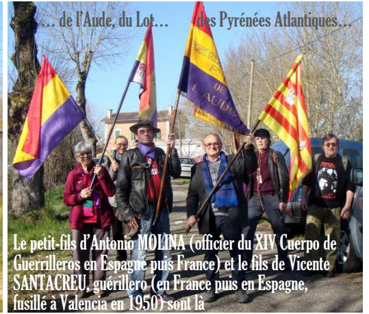
... de l'Aude, du Lot... des Pyrénées Atlantiques...