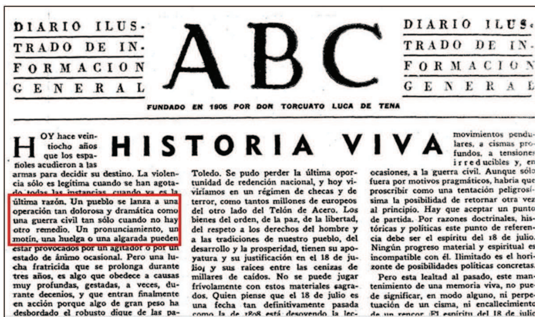
Imagen 2: Primera página de ABC del 18 de julio de 1964

cuando la dictadura celebraba “veinte y cinco [o treinta] años de paz” y la “reconciliación de los españoles”, el uso de “guerra civil” se acentuó en discursos y relatos: relato del aparato político del estado, relato de los medios de comunicación, relato escolar 41 y académico.