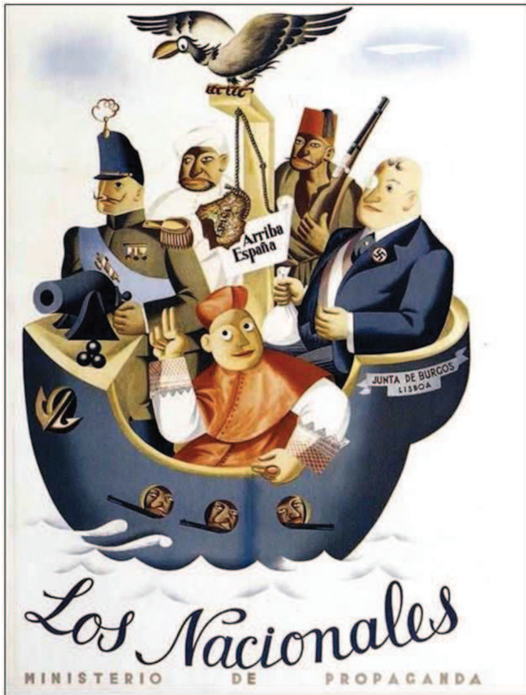
Imagen 7: Cartel republicano, contra los pretendidos “Nacionales”

El cartel republicano reproducido en la Imagen 7 representa “ Los Nacionales ”: en un buque armado, procedente de Lisboa (Portugal de Salazar), bautizado “ Junta de Burgos ”, están representados los llamados “Nacionales”: un militar mussoliniano, mercenarios marroquíes, un banquero hitleriano y un clérigo.