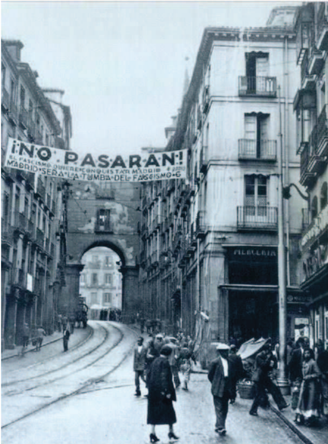
Imagen 5: Banderola republicana, Madrid contra el fascismo

segunda fila, aparece el emblema de los falangistas españoles, el yugo y las flechas , pero detrás de una mayor esvástica. A la derecha de la tercera fila, tres personajes (un militar, un burgués, un cura) aguantan la capa de La Muerte que lleva esvástica y casco alemán.