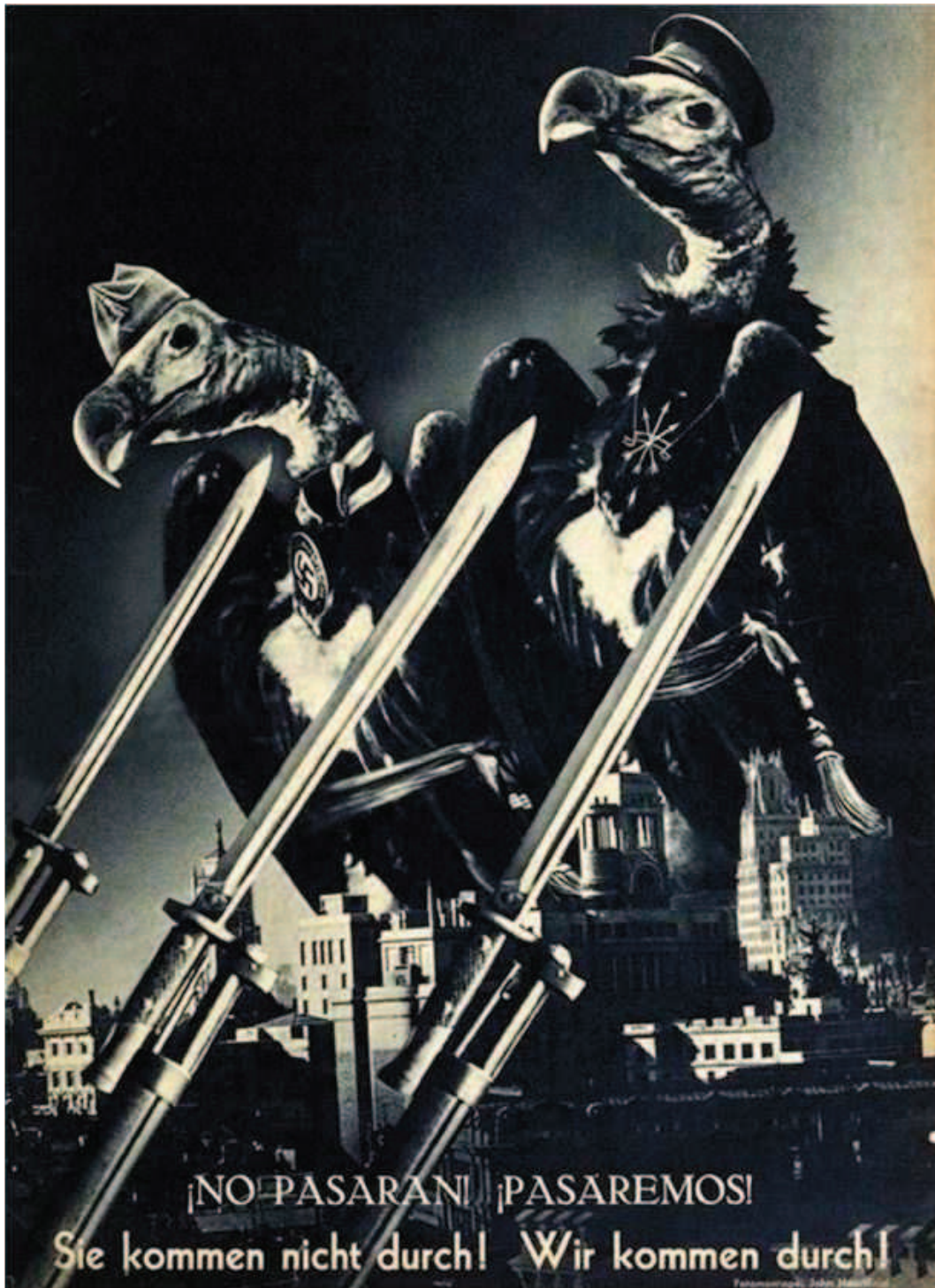
Imagen 6: Cartel republicano, Madrid contra el fascismo

La Imagen 6 reproduce un cartel que proclama: “ ¡No pasarán! ”, en español y alemán, debajo de dos buitres que representan Hitler y Franco sitiando a Madrid.