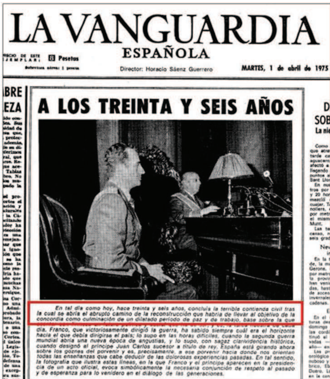
Imagen 3: La Vanguardia del 1 de abril de 1975

Esta denominación podía convenir también a los partidarios de la "No Intervención", para ignorar la política liberticida, de inspiración fascista 42 , de los atacantes de la República y establecer relaciones con ellos 43 .