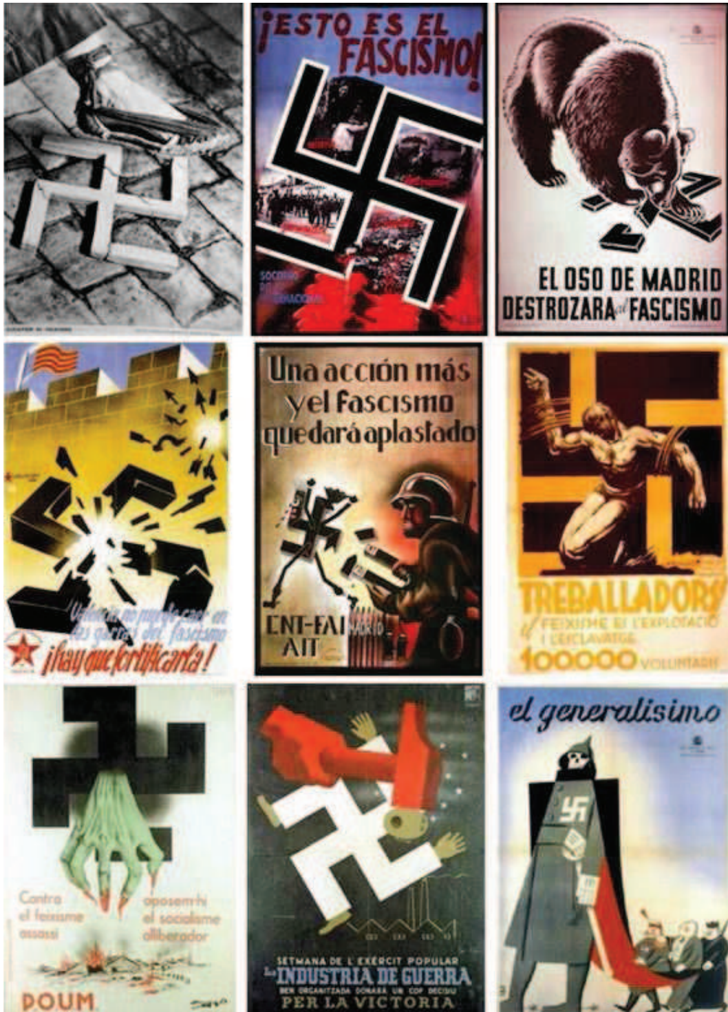
Imagen 4: Carteles republicanos (Fuente: composición de carteles publicados mientras la guerra, recuperados de internet, http://pares.mcu.es/cartelesGC )

Arriba a la izquierda, se reproduce un famoso cartel publicado en mayo de 1937 por la Generalitat de Catalunya : un pie de mujer rompe una cruz gamada; dice la leyenda (en la parte inferior izquierda del cartel): “ Aixafem el feixisme ” (aplastemos al fascismo); este cartel muestra lo que significa la guerra para el gobierno catalán: resistir a aquellos que quieren acabar con la República es luchar contra el nazismo (la Alemania de Hitler). A la izquierda de la